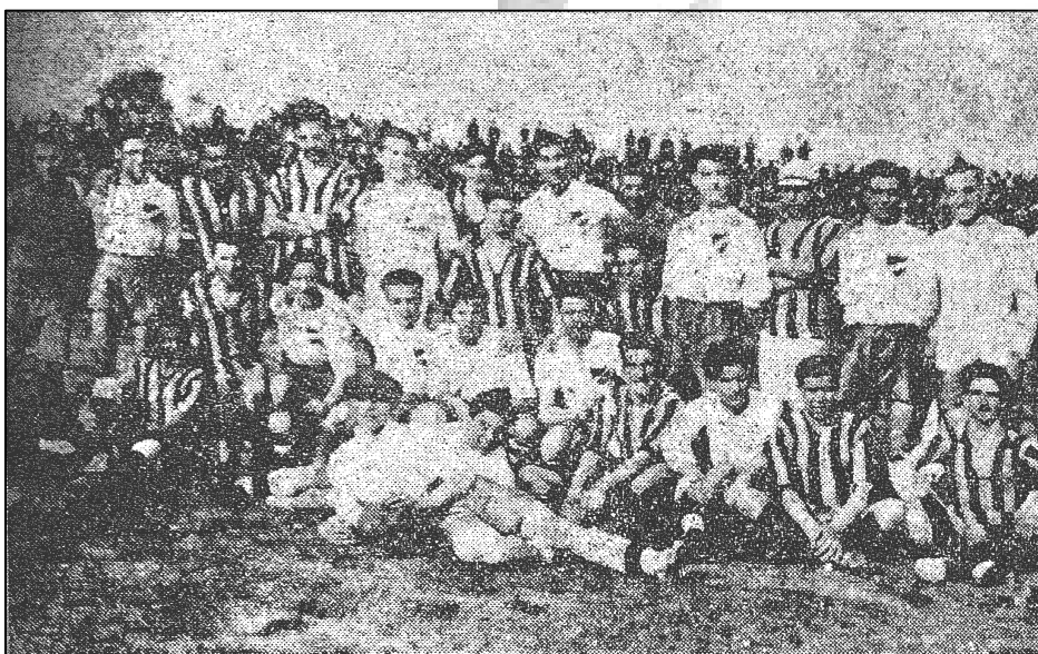
Equipos de Peñarol y Nacional el día del clásico Diario La Razón – Miércoles 20 de agosto de 1924

Instituciones actuales como Peñarol, Nacional, Sud América, Sporting (previo a la fusión con Defensor), Atenas, Aguada, Macabi, Goes, Stockolmo y Olimpia participaron en diferentes períodos.