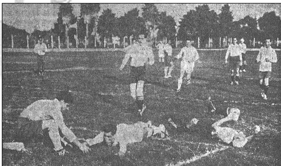
Torneo del Centenario – 1931 Diario La Mañana – domingo 24 de mayo de 1931

A nivel de selecciones se disputó el Torneo Río de la Plata en cuatro oportunidades entre 1923 y 1929. En 1931 se desarrolló en una doble jornada en el Parque de los Aliados el último enfrentamiento clásico en esta modalidad, dentro del marco del denominado Torneo del Centenario .