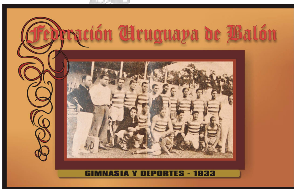
Centro Atlético Gimnasia y Deportes Pionero del Balón Uruguayo

En Argentina, Boca Juniors, River Plate e Independiente entre otros, se enfrentaron con equipos uruguayos como Gimnasia y Deportes , pionero del Balón en el Río de la Plata.