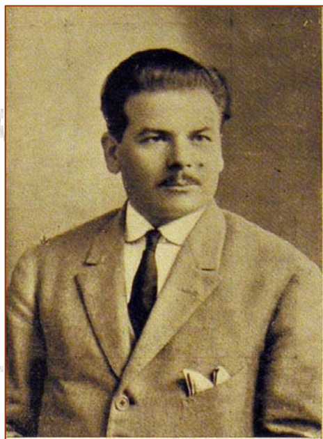
Antonio Valeta (1882 – 1945)

A partir de 1921 con la creación de la Federación Uruguay de Balón comienza la actividad local y se realizan partidos internacionales con Argentina (que en el mismo año también fundó su Federación) tanto a nivel de clubes como de selecciones.