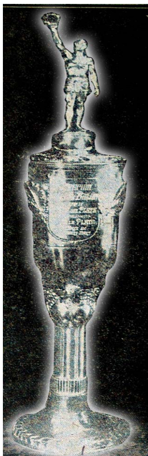
Copa El Plata

Otros Clubes actuales como Peñarol, Nacional, Sud América, Sporting, Aguada, Goes, Stockolmo, Macabi y Olimpia también participaron en este deporte en diferentes períodos. La cancha de los Pocitos (de Peñarol), el Parque Central entre otros, fueron escenario de los encuentros de Balón.